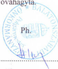
Hosszú-Kanász Eszter polgármester